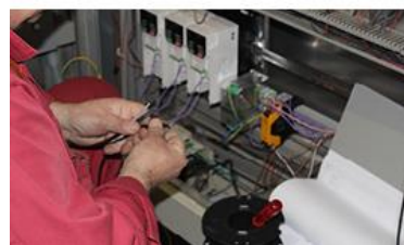
Text: Michael Kummer